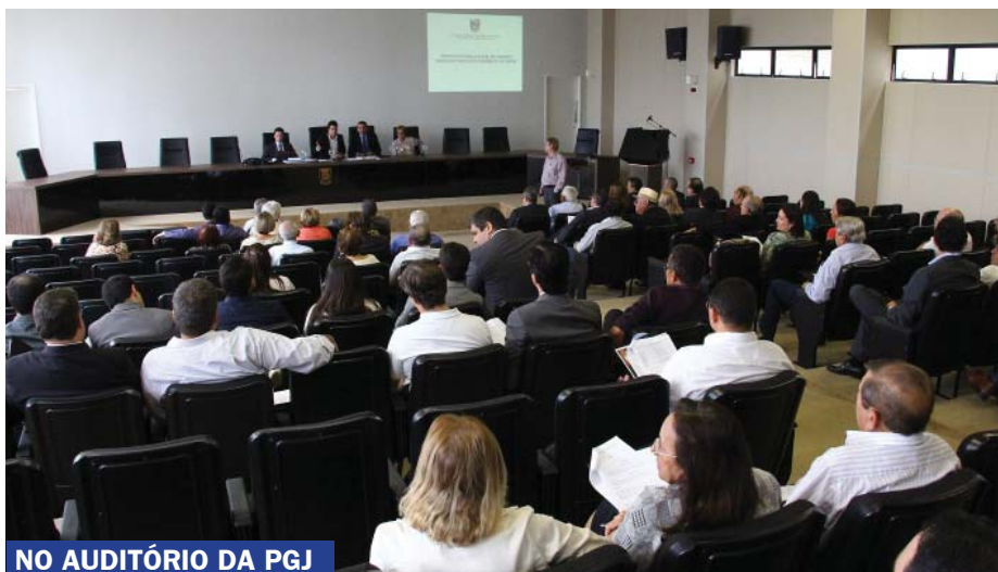
NO AUDITÓRIO DA PGJ

A mesa da Assembleia foi composta pelo procurador-geral de Justiça, Bertrand de Araujo Asfora; o presidente da APMP, Francisco Seráfico; a procuradora aposentada e ex procuradora-geral, Socorro Diniz; e o secretário-geral da APMP, Rodrigo Pires.